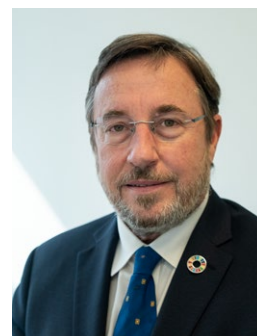
Ахим Штайнер, администратор Программа развития Организации Объединенных Наций (ПРООН)

Приглашаю вас ознакомиться со стратегией и получить дополнительные сведения. При поддержке и сотрудничестве с нашими партнерами из системы Организации Объединенных Наций — включая наше тесное партнерство со структурой «ООН-женщины» — и за ее пределами, ПРООН будет продолжать действовать совместно со странами и сообществами, чтобы расширить для людей возможности выбора и построить справедливый и более равноправный мир.